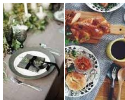
テーブルリネン等