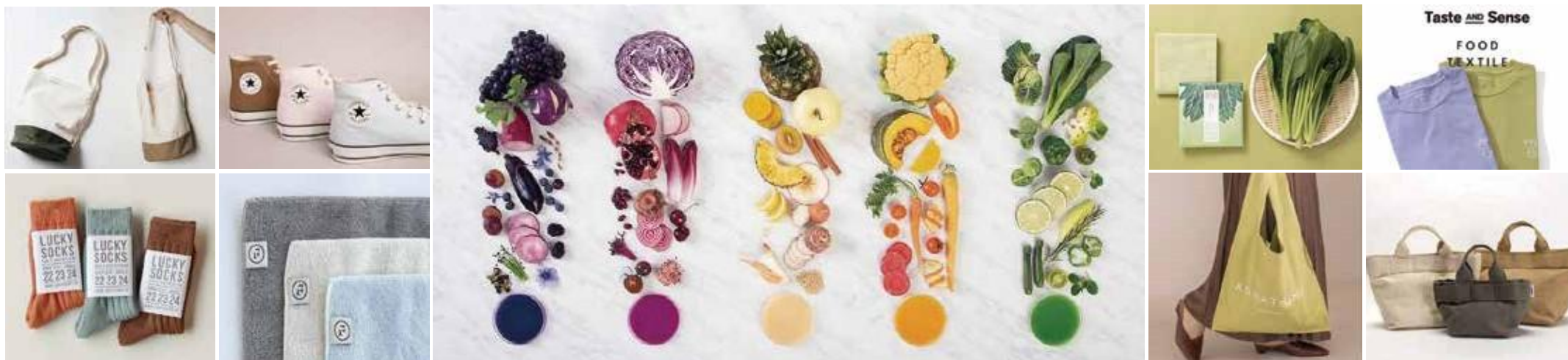
FOOD TEXTILE 製品化までの流れ

フードテキスタイルは、廃棄予定の野菜や食材で染めたサステイナブルなプロジェクトです。従来捨てられていた、形の不揃いなどの規格外の食材や、カット野菜の切れ端、コーヒーの出し殻などを、食品関連企業や農園より買い取り、植物に含まれる成分を抽出、それを染料にして染め上げています。