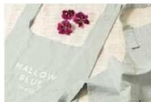
ECサイト販売で新たな収益