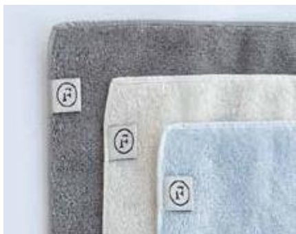
オリジナルハンカチ