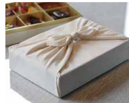
アルマーニ/リストラテー 風呂敷