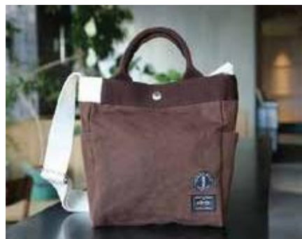
猿田彦珈琲 × PORTER ハンドバッグ