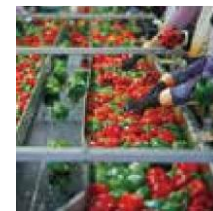
食品製造での野菜の加工