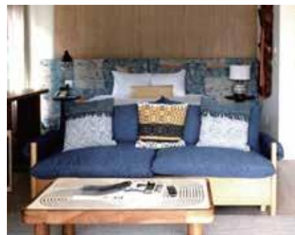
インテリアファブリック・家具の張り地等