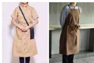
ユニフォームや店舗内で活用