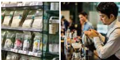
食品の製造 販売 コーヒーの提供