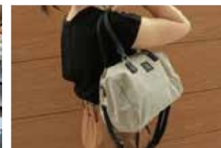
ノベルティとしてお客様へ配布