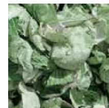
野菜の切れ端や規格外の食品