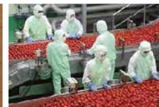
作業ウェアとして活用