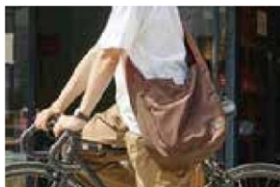
新しくブランド・商品を開発