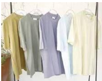
オリジナルシャツ