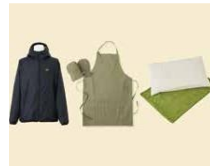
伊藤園 各種繊維製品