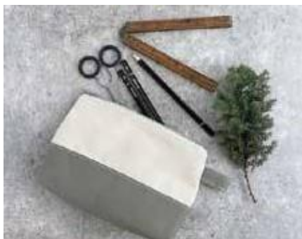
オリジナルポーチ