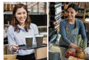
ユニフォームや店舗内で活用