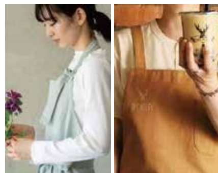
生活の木/THE ALLEY スタッフ用エプロン