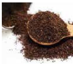
抽出後のコーヒー豆/販売規格外の食品